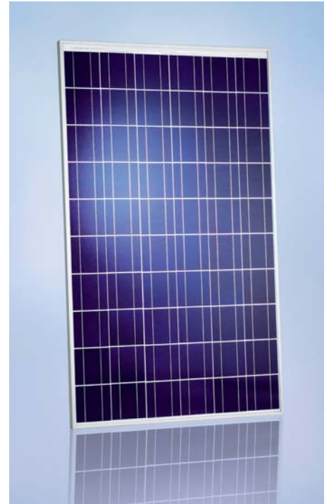
SCHOTT POLY™ 210/217/225